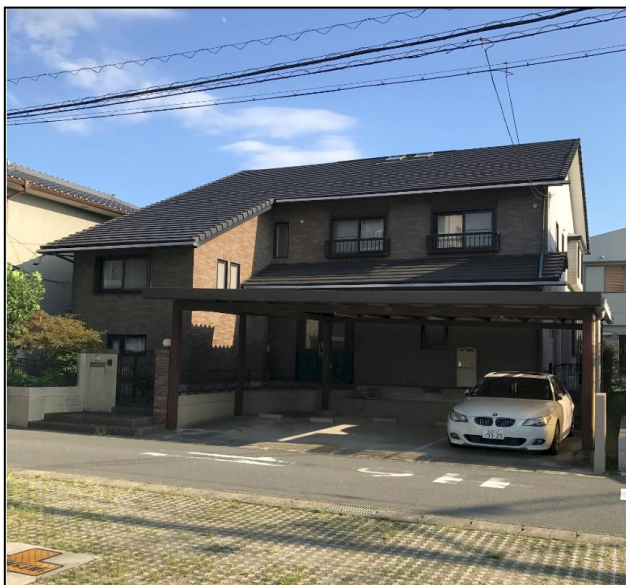
北側から撮影 (玄関・カーポート)